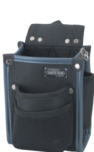
KNW-010 小型電工袋2段 ●サイズ: H215・W140・T150mm ●JAN: 111177 ●標準小売価格: 2,900円

ポケットの内側が手を出し入れする時に擦れないようにていねいな仕上げになっていてさらに奥行きがあるので、手が痛くありません。