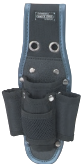
KNW-085 ツールケース4丁差 ●サイズ: H260・W85・T75mm ●JAN: 111146 ●標準小売価格: 1,600円