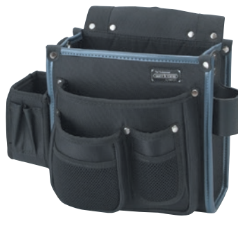
KNW-002 仮枠袋墨差付 ●サイズ: H270・W240・T200mm ●JAN: 111214 ●標準小売価格: 5,500円