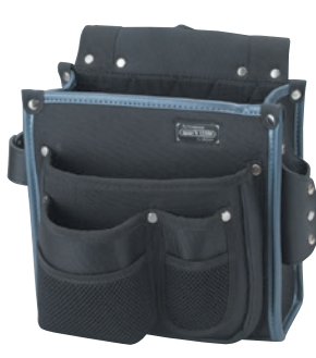
KNW-001 仮枠袋工具差付 ●サイズ: H270・W240・T200mm ●JAN: 111207 ●標準小売価格: 5,150円