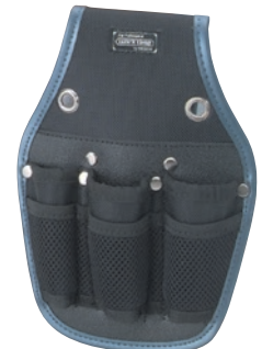
KNW-083 ツールケース3丁差 ●サイズ: H270・W180・T40mm ●JAN: 111368 ●標準小売価格: 1,500円