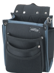
KNW-012 電工袋3段 ●サイズ: H250・W170・T180mm ●JAN: 111191 ●標準小売価格: 4,200円