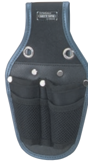
KNW-082 ツールケース2丁差 ●サイズ: H245・W130・T30mm ●JAN: 111139 ●標準小売価格: 1,350円