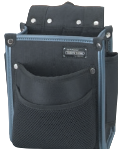
KNW-011 電工袋2段 ●サイズ: H250・W170・T160mm ●JAN: 111184 ●標準小売価格: 3,550円