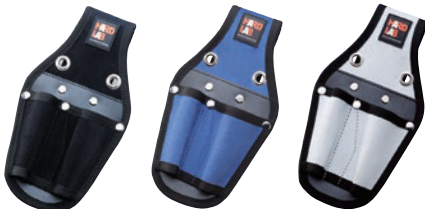
HL-102B HL-102N HL-102W