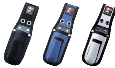
HL-106B HL-106N HL-106W