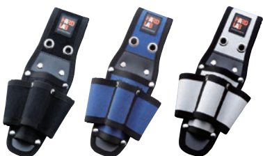
HL-104B HL-104N HL-104W