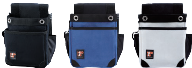
HL-203B HL-203N HL-203W