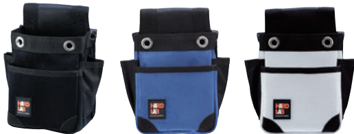
HL-201B HL-201N HL-201W