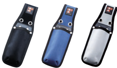
HL-105B HL-105N HL-105W