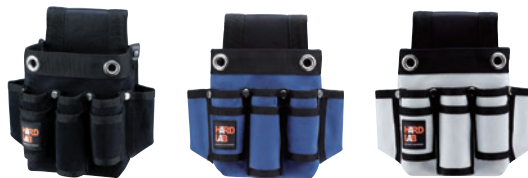
HL-202B HL-202N HL-202W