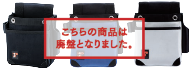
HL-204B HL-204N HL-204W