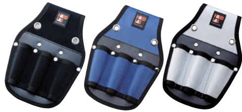
HL-103B HL-103N HL-103W