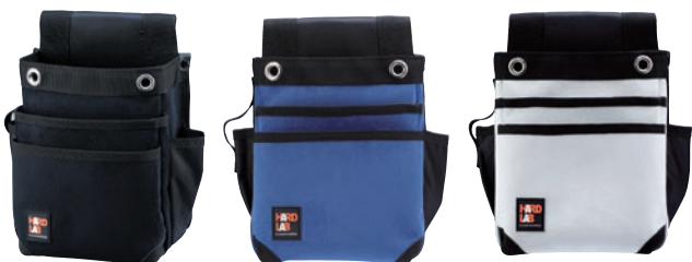
HL-205B HL-205N HL-205W