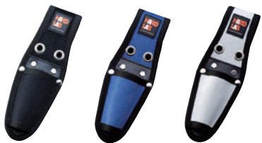
HL-101B HL-101N HL-101W