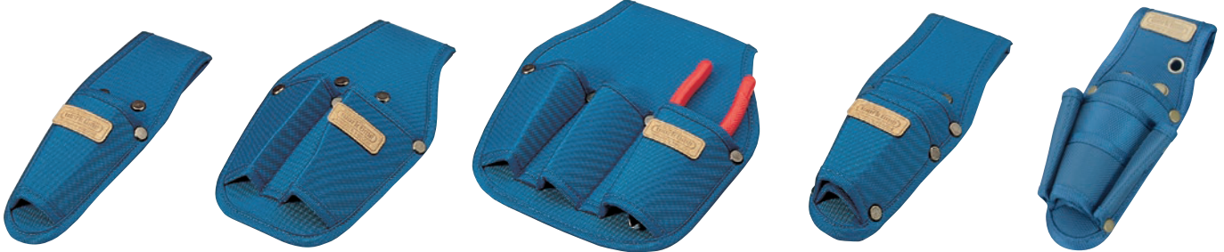
KN-81 ツールケース1丁差