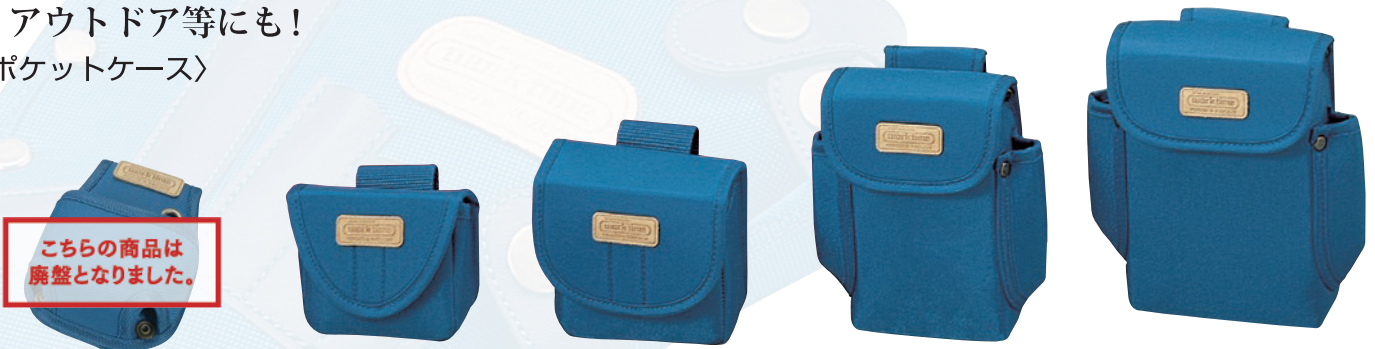
KN-75 コンベックスケース