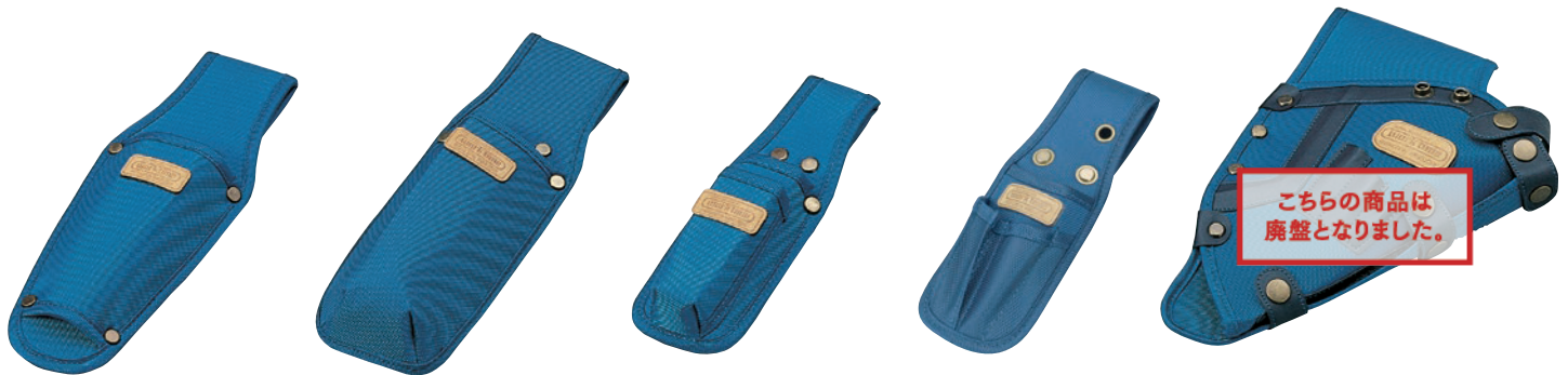
KN-71 ミゼットカッターケース